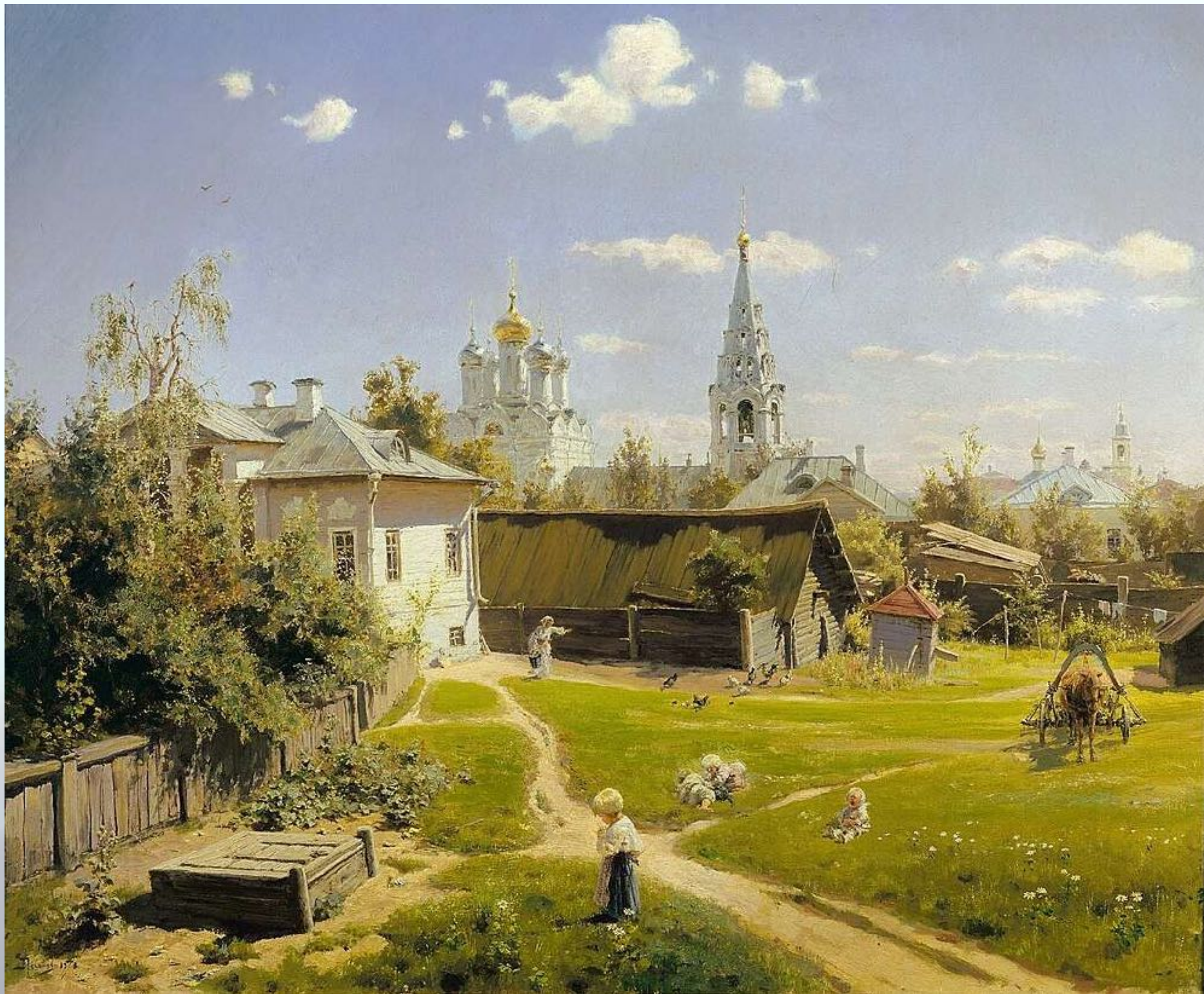
Василий Дмитриевич Поленов «Московский дворик»