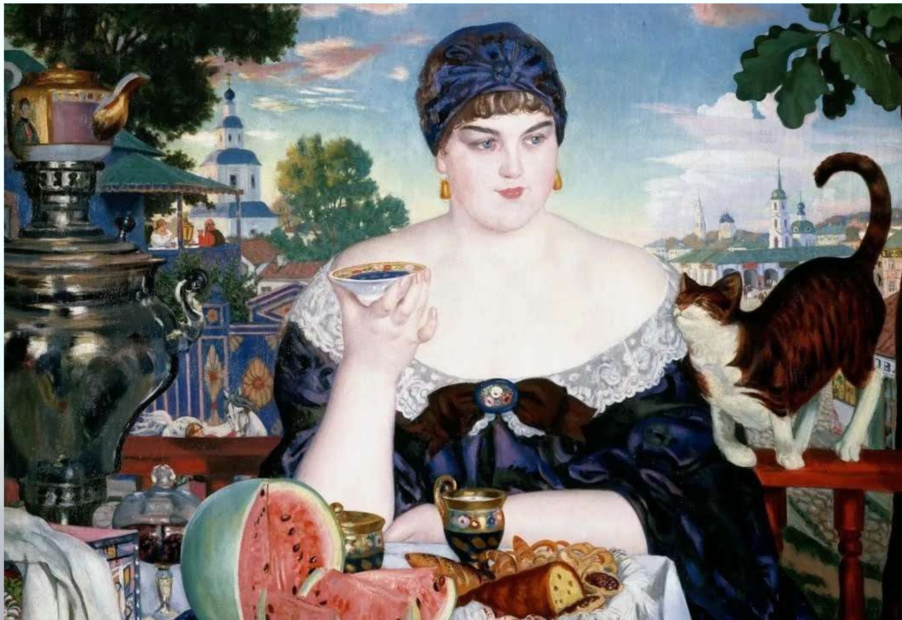
Борис Михайлович Кустодиев «Купчиха за чаем»