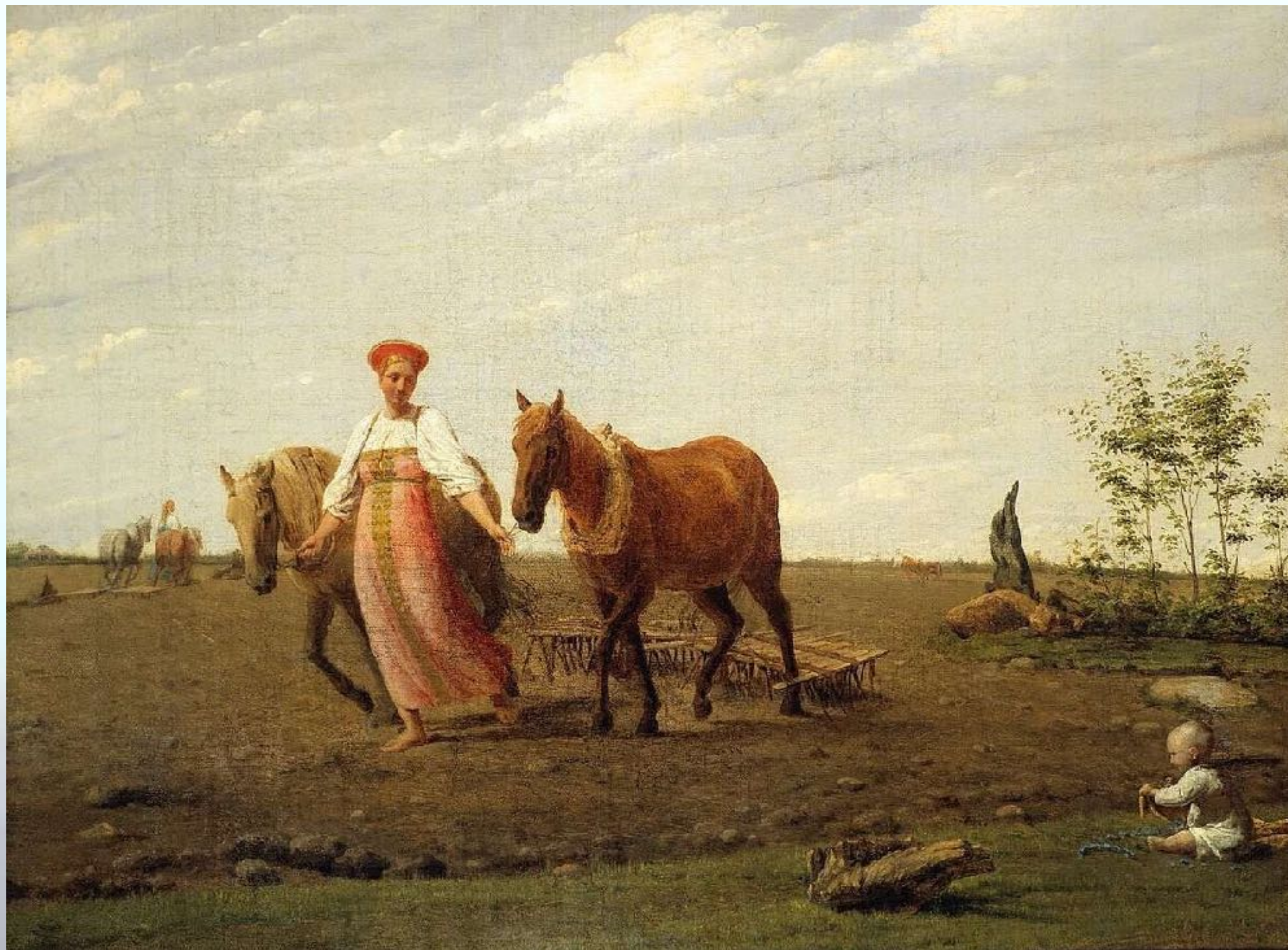
Алексей Гаврилович Венецианов «На пашне. Весна»