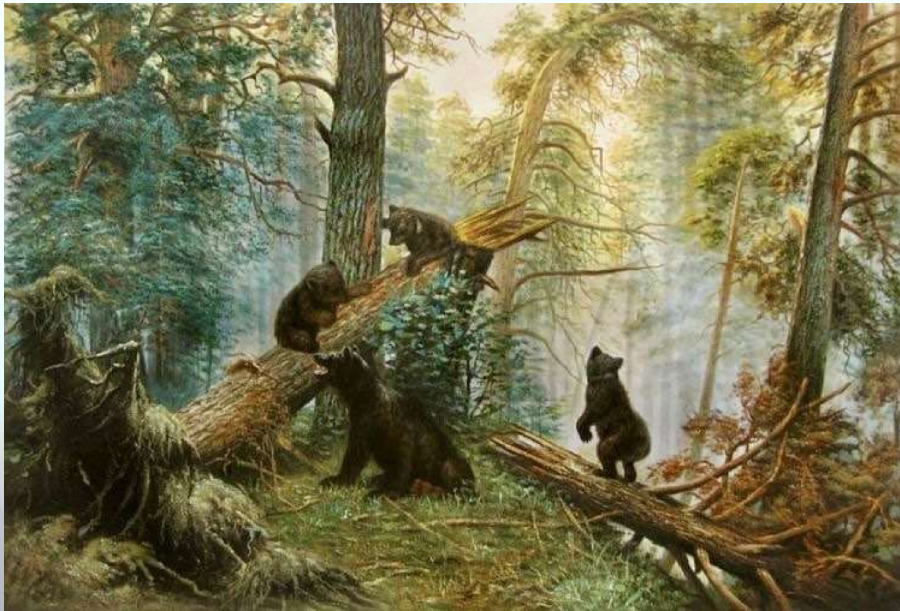
Иван Иванович Шишкин «Утро в сосновом лесу»