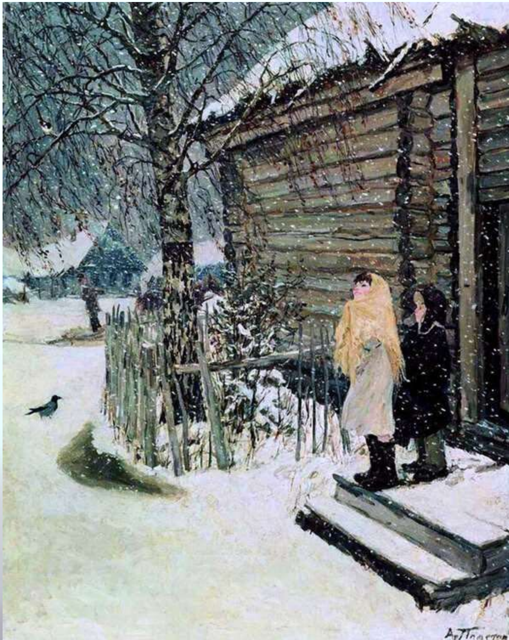
Аркадий Александрович Пластов «Первый снег»