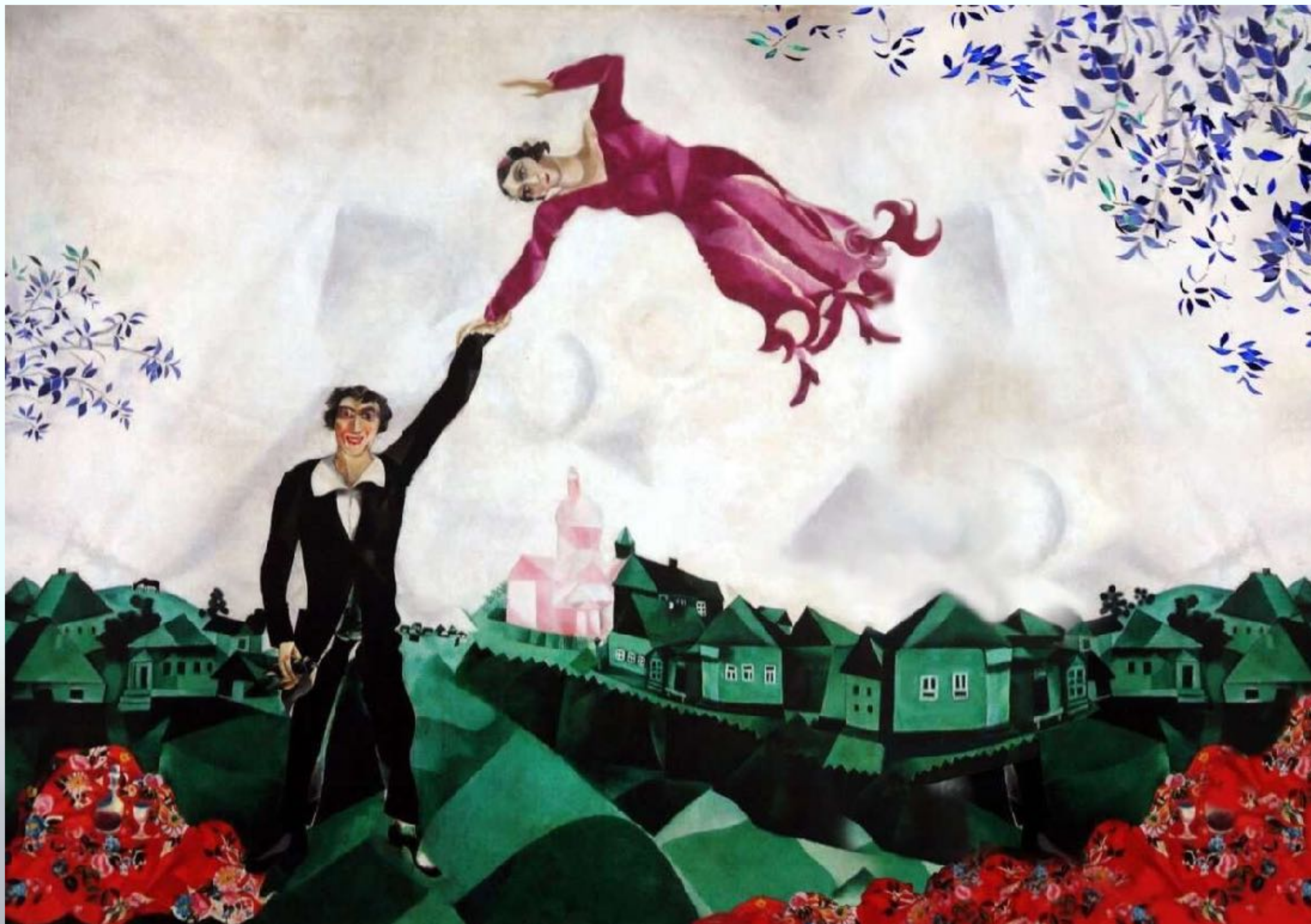
Марк Захарович Шагал «Прогулка»