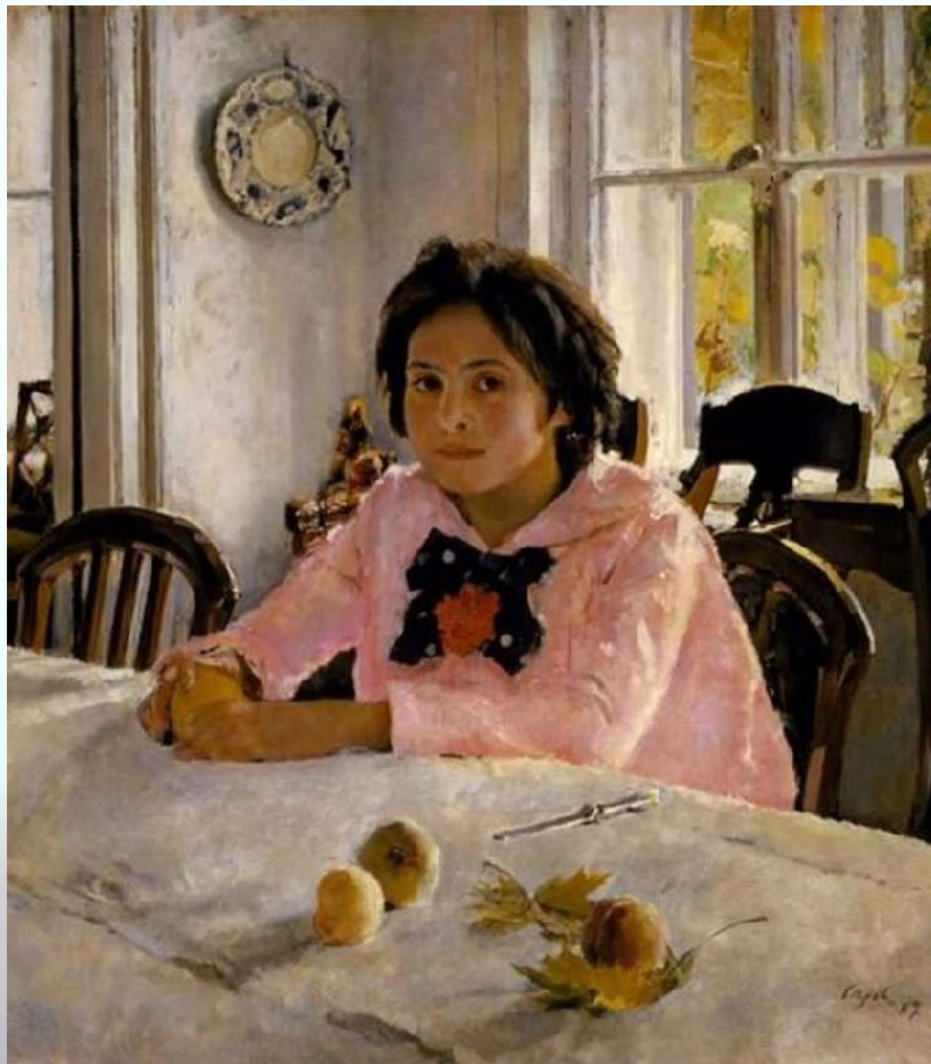
Валентин Александрович Серов «Девочка с персиками»